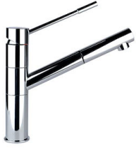
Monomando Lorenzo 8466 000