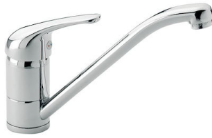
Monomando S1000 - RO 8443 002